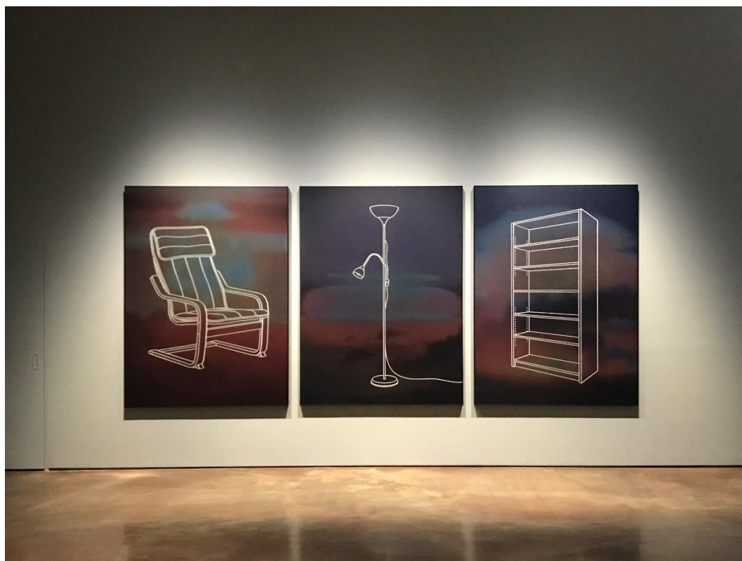
Gao Lei, Test Substance(测试物), 2017, UV print on aluminium board, 194x143x5cm(each)