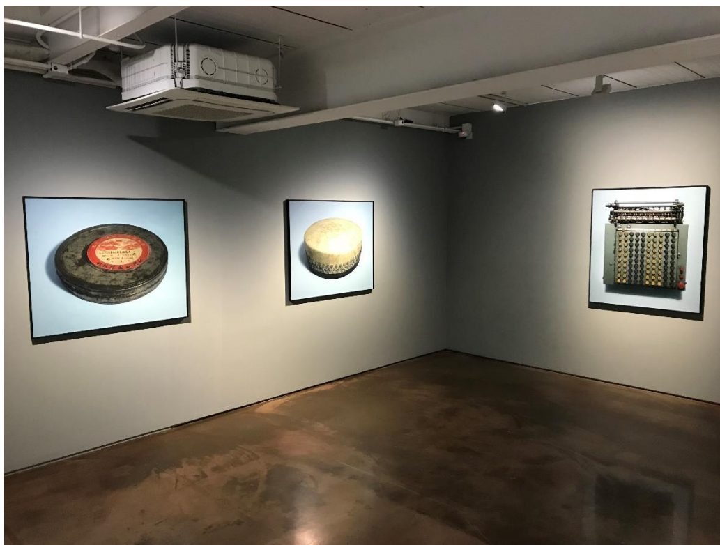
가오 레이 <배후의 조정자(Enzyme of Trial)> 전시 전경, 아라리오갤러리 서울 1층