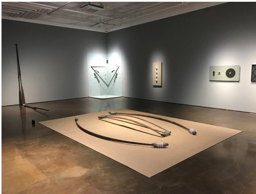
가오 레이 <배후의 조정자(Enzyme of Trial)> 전시 전경, 아라리오갤러리 서울 지하 1층