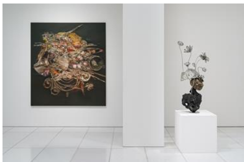
Installation view at ARARIO GALLERY SEOUL (1F)

※ Credit for all Artwork Images: © Subodh GUPTA. Courtesy of the Artist & Arario Gallery.