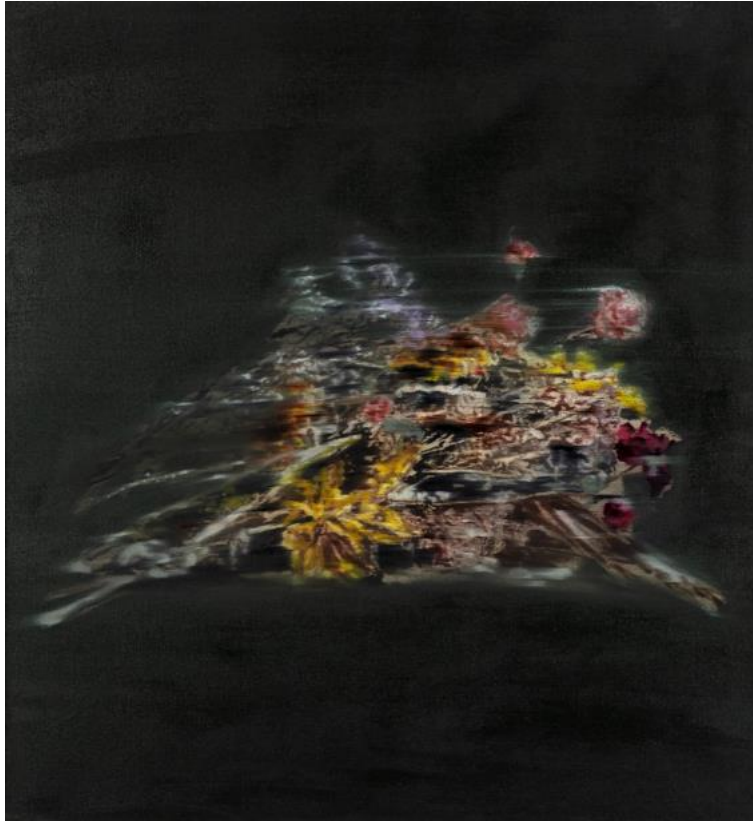
수보드 굽타, <이너 가든 VII>, 2024, 리넨에 유채, 130 x 120 cm