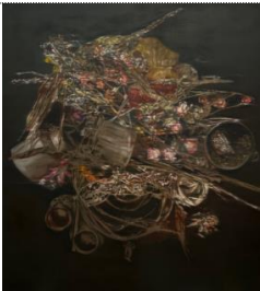
Subodh GUPTA Inner Garden V (2024) Oil on linen 200 x 180 cm

✂ Credit for all Artwork Images: © Subodh GUPTA. Courtesy of the Artist & Arario Gallery.