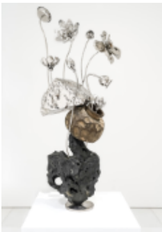
Subodh GUPTA Inner Garden I (2024) Stainless steel, brass, PU Paint 63 x 55 x 131(h) cm

The Inner Garden (2024) series presented in this exhibition comprises of semi-abstract paintings and figurative sculptures inspired by forms found in nature. This series centrally explores the spiritual process of developing an intimate relationship with nature. The paintings visualize emotions derived from reflections on communication and connection with the natural world, drawing upon memories, sensations, and experiences associated with specific objects and places. GUPTA's new paintings show at the center of each canvas, still-life forms depicted in fluid, dynamic shapes, with the distinctive composition and expressive techniques symbolically revealing the resilient power, perseverance, and restorative qualities of nature.