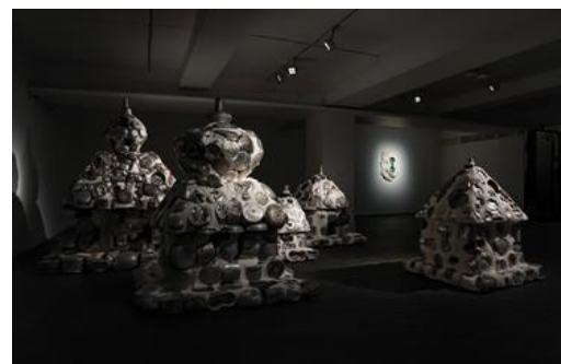
Installation view at ARARIO GALLERY SEOUL (B1F)