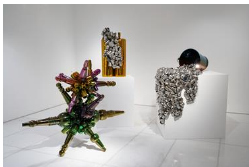
Installation view at ARARIO GALLERY SEOUL (3F)