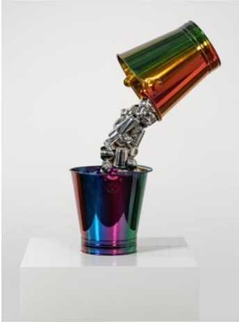
수보드 굽타 〈조디악의 빛〉(2024) 스테인레스 스틸, PU 페인트 36 x 55 x 88(h) cm

※ 고화질 이미지는 웹하드에서 다운로드하실 수 있습니다. 사용 시 다음의 저작권 표기를 부탁드립니다.