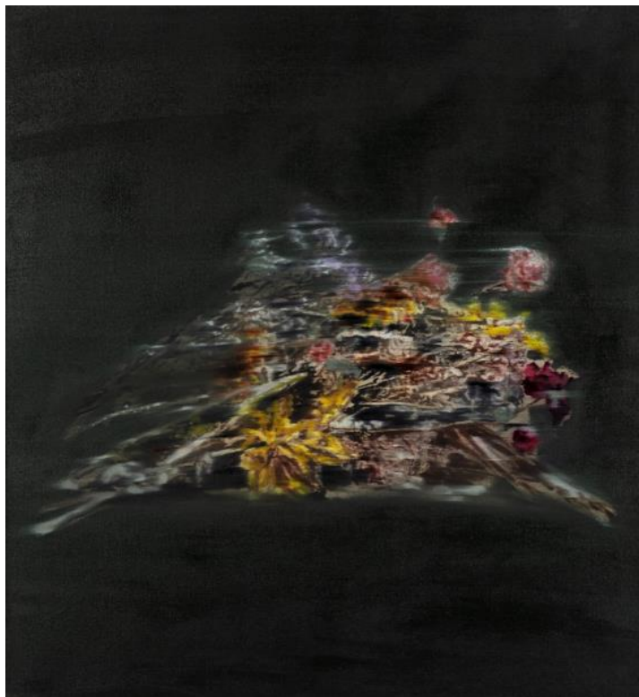
Subodh GUPTA, Inner Garden VII , 2024, Oil on linen, 130 x 120 cm ©2024. Subodh Gupta. Courtesy of the Artist and ARARIO GALLERY