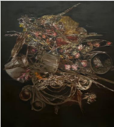
수보드 굽타 〈이너 가든 V〉(2024) 리넨에 유채 200 x 180 cm