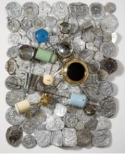
Subodh GUPTA Proust Mapping II (2024) Aluminum, stainless steel, found objects 140 x 24 x 195(h) cm