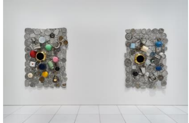
아라리오갤러리 서울 1층 전시전경