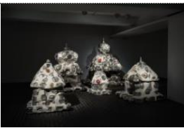
Subodh GUPTA Stupa (2024) Aluminum, plaster Dimensions variable

Utensils, each bearing its own history, memories, and traces of life, evokes long-forgotten memories in those who view them. Gupta recontextualizes ordinary objects as symbolic elements that evoke cultural memory and spiritual resonance. The Proust Mapping series arranges objects on a flat surface to evoke the emotions, memories, and histories inherent within both individuals and communities. By presenting everyday materials, the artwork establishes a dialogical relationship between the viewer and the piece, further reinforcing the inevitable connection between humble domestic labor and the structures of industrial mass production.