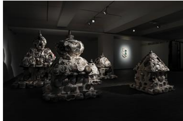
아라리오갤러리 서울 지하 1층 전시전경