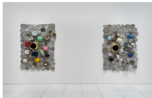
Installation view at ARARIO GALLERY SEOUL (1F)