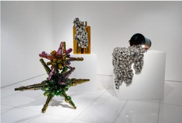
아라리오갤러리 서울 3층 전시전경