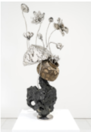
수보드 굽타 〈이너 가든 I〉(2024) 스테인레스 스틸, 황동, PU 페인트 63 x 55 x 131(h) cm

이번 전시에 선보이는 〈이너 가든〉(2024) 연작은 반(半)추상 형식의 회화 및 자연의 형태를 참조한 구상 조각으로 구성된다. 해당 연작은 공통적으로 자연과의 친밀한 관계를 발전시켜 나아가는 영적 과정을 주제 삼는다. 회화 작품들은 자연과의 소통 및 관계에 대한 고찰로부터 발견한 정서를 시각화한 결과물로서, 특정한 사물 및 장소에 담긴 기억과 감각, 경험을 소재로 취한다. 각 화면 중앙에는 정물의 형태가 움직이듯 유동적인 형상으로서 묘사된다. 특유의 화면 구성 및 표현 방식이 자연의 강인한 힘과 끈기, 회복력을 상징적으로 드러낸다.