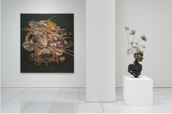
아라리오갤러리 서울 1층 전시전경

※ 고화질 이미지는 웹하드에서 다운로드하실 수 있습니다. 사용 시 다음의 저작권 표기를 부탁드립니다. ©Subodh GUPTA. 작가 및 아라리오갤러리 제공.